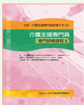
●専門研修課程Ⅱ 定価 3,700 円 (送料・税別)