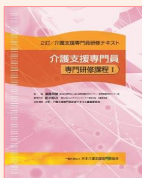
●専門研修課程Ⅰ 定価 4,500 円 (送料・税別)