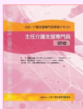
●主任研修 定価 3,700 円 (送料・税別)